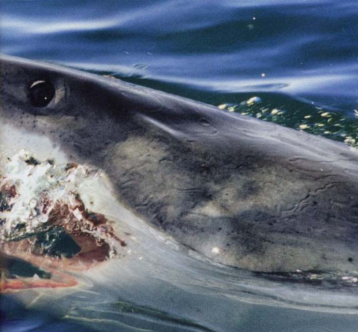
Großes Hai-Kino - Weiße Haie stürzen sich selten wie wild auf den Köder. Vielmehr nähern sie sich in der Regel vorsichtig dem ausgeworfenen Fressköder

Schon seit fast einer Stunde sitze ich im Käfig neben der Bordwand und warte gemeinsam mit einem meiner Mitstreiter auf den großen Moment. Wellen schwappen in mein Gesicht, der Körper zittert wegen der beginnenden Auskühlung. Irgendwie hatten wir uns die Sache anders gedacht. Gemütlich im Käfig unter Wasser das große Hai-Kino an uns vorbeiziehen zu lassen, das war unsere Vorstellung. Wie wir aber erfahren müssen, sind die Tiere viel scheuer als ihr Ruf – das Geblubber der Regulatoren verscheucht sie sofort. So heißt es also, mit