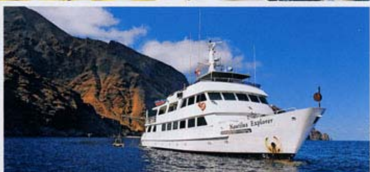
Gut gesichert - Die Haiküfige bestehen aus einem stabilen Stahlgerüst. Übrigens: Eine Tauchausrüstung ist oftmals nicht notwendig - die Luftversorgung wird per Schlauch vom Boot aus betrieben (ganz oben). Die „Nautilus Explorer“ vor der Isla Guadalupe im Pazifik